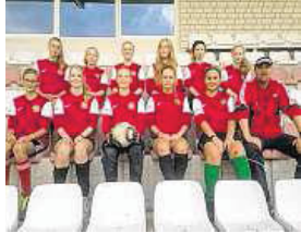
Die Fußballerinnen des FC Oberneuland suchen Verstärkung.

Oberneuland (rtr). Die Nachwuchsfußballerinnen des FC Oberneuland brauchen Verstärkung. Gesucht werden Spielerinnen der Jahrgänge 1997 bis 2001. Derzeit spielen die B-Juniorinnen des FCO in der 9er-Liga. Zuletzt wurde ein FCO-Team in der Saison 2012/13 Staffelleister der C-Juniorinnen. 2013/14 erreichten die B-Juniorinnen einen soliden dritten Platz, während sich die C-Juniorinnen den herausragenden ersten Platz sicherten. Erfolgreich soll es auch künftig weitergehen. Neben dem Angriff auf die jeweilige Tabellenspitze soll im kommenden Jahr eine Damenmannschaft gegründet werden. Interessierte können sich unter b-maedchen.fco@web.de informieren oder einfach mal an einem Training teilnehmen. Trainiert wird mittwochs und freitags von 18 bis 19.30 Uhr beim FC Oberneuland am Vinnenweg 100.